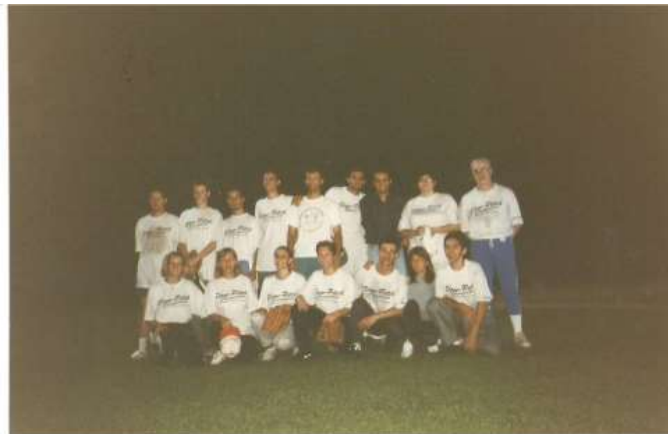
Formazione a sinistra

2° Torneo Notturno “ Slow-Pitch “ Numero 4 squadre partecipanti : B-Team – Mare 1 – White Zoz – Amici di Forno