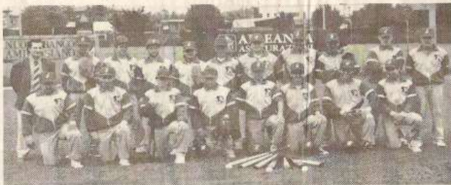
La formazione del Baseball Conegliano. Sabato e domenica proporrà un triangolare da spettacolo

Atteso in particolare il "derby" con i ponzanesi neo promossi in C2