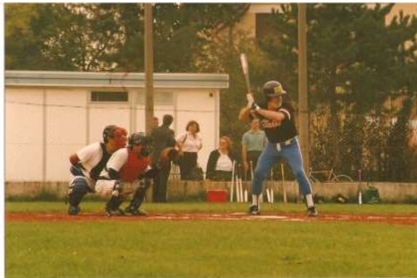
Torneo " Vecchie Glorie " Giovanni Forno alla Battuta